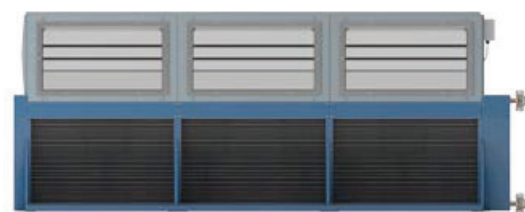
Dry cooler radial frontal Frontal radial dry cooler