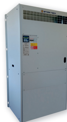
L'immagine sopra riportata è puramente a titolo indicativo The image above is purely indicative

Indoor packaged air conditioning units air cooled type, ideals for installations inside room, shelter for radio base station and data processing centre.