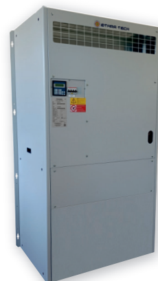
L'immagine sopra riportata è puramente a titolo indicativo The image above is purely indicative

POTENZA FRIGORIFERA DA 6,1 A 13,9kW Cooling capacity from 6,1 to 13,9kW