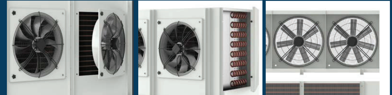
Ventiladores con bisagras Hinged fans