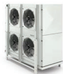
Modelo KEB Modelo KEB