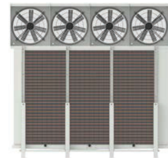
Modelo KEV Model KEV