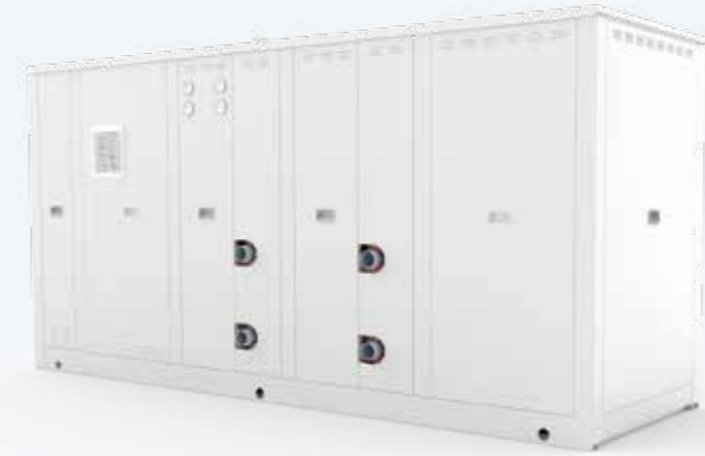
MEDIUM COOLING CAPACITIES REFRIGÉRATEUR ALTERNATIF REFRIGÉ À L'EAU AU PROPANE pour usage intérieur et extérieur.