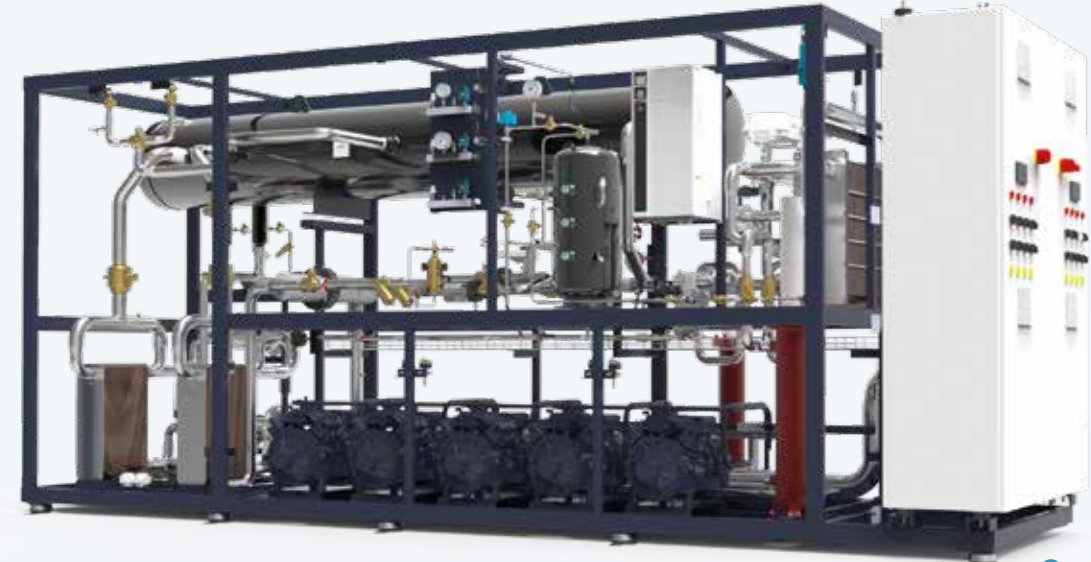
MEDIUM COOLING CAPACITIES SPLIT DU CO 2 TRANSCRITIQUE REFRIGÉRATEUR ALTERNATIF REFRIGÉ PAR AIR avec gas cooler à distance.