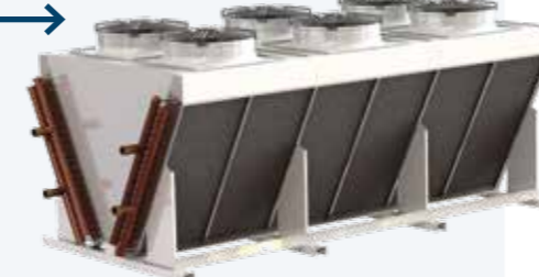
DRY COOLER avec ventilateurs axiaux pour usage extérieur.