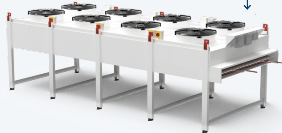
GAS COOLER À DISTANCE avec ventilateurs axiaux pour usage extérieur.