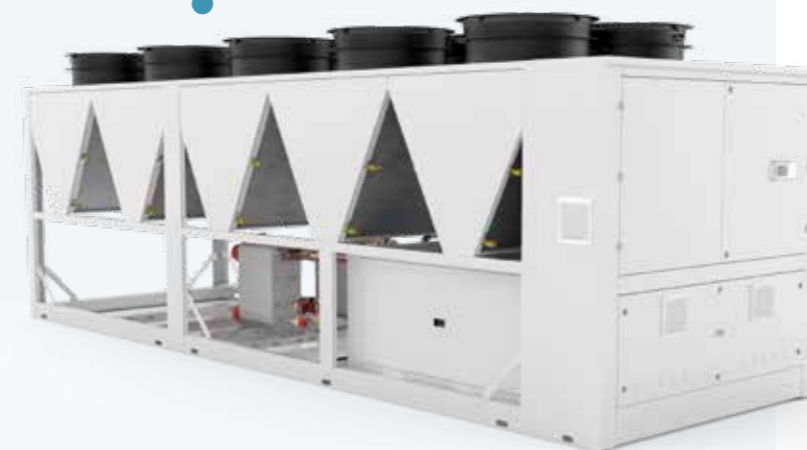
REFRIGÉRATEUR À VIS REFRIGÉ PAR AIR AU PROPANE pour usage extérieur.