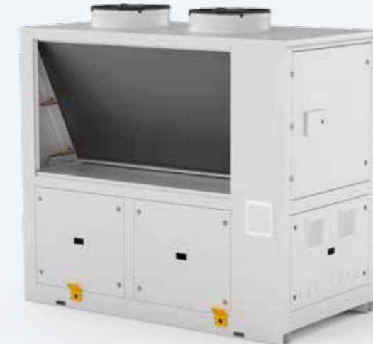
SMALL COOLING CAPACITIES