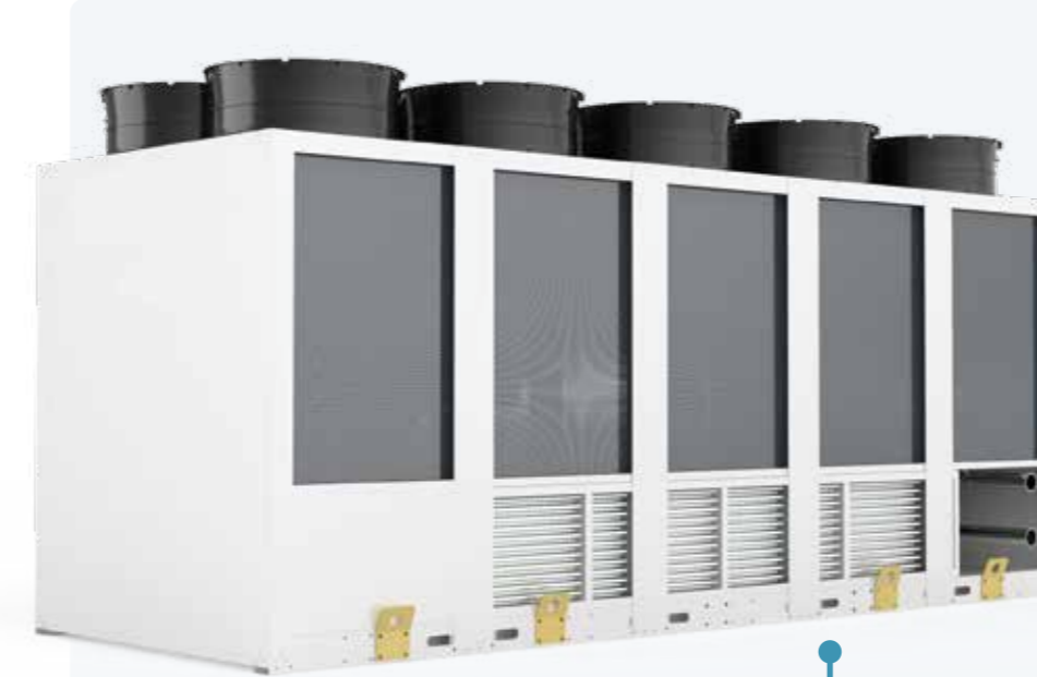
LARGE COOLING CAPACITIES